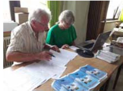
Das Schiedsgericht bei der Arbeit

208 Wanderer insgesamt erwanderten 2145 km