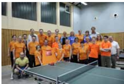
Teil der Tischtennisabteilung

2017 feiert die Tischtennisabteilung ihr 50-jähriges Jubiläum und die Volleyballabteilung ihr 10-jähriges, so dass die Aktivitäten gleich weitergingen.